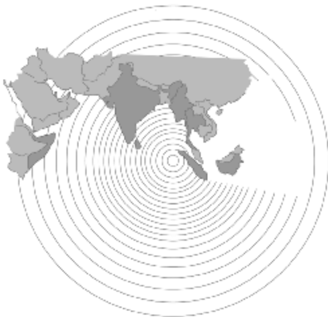
Figuur 2: Hulporganisaties in getroffen landen.

Ieder van de SHO-leden verleent hulp door het financieren van projecten die hun lokale partnerorganisaties in het rampgebied uitvoeren. In sommige gevallen lopen de bijdragen via een internationale koepel. De uitvoerende organisaties zijn vermeld in bijlage 3. Zij rapporteren regelmatig aan de SHO-leden over de voortgang van hun werkzaamheden.