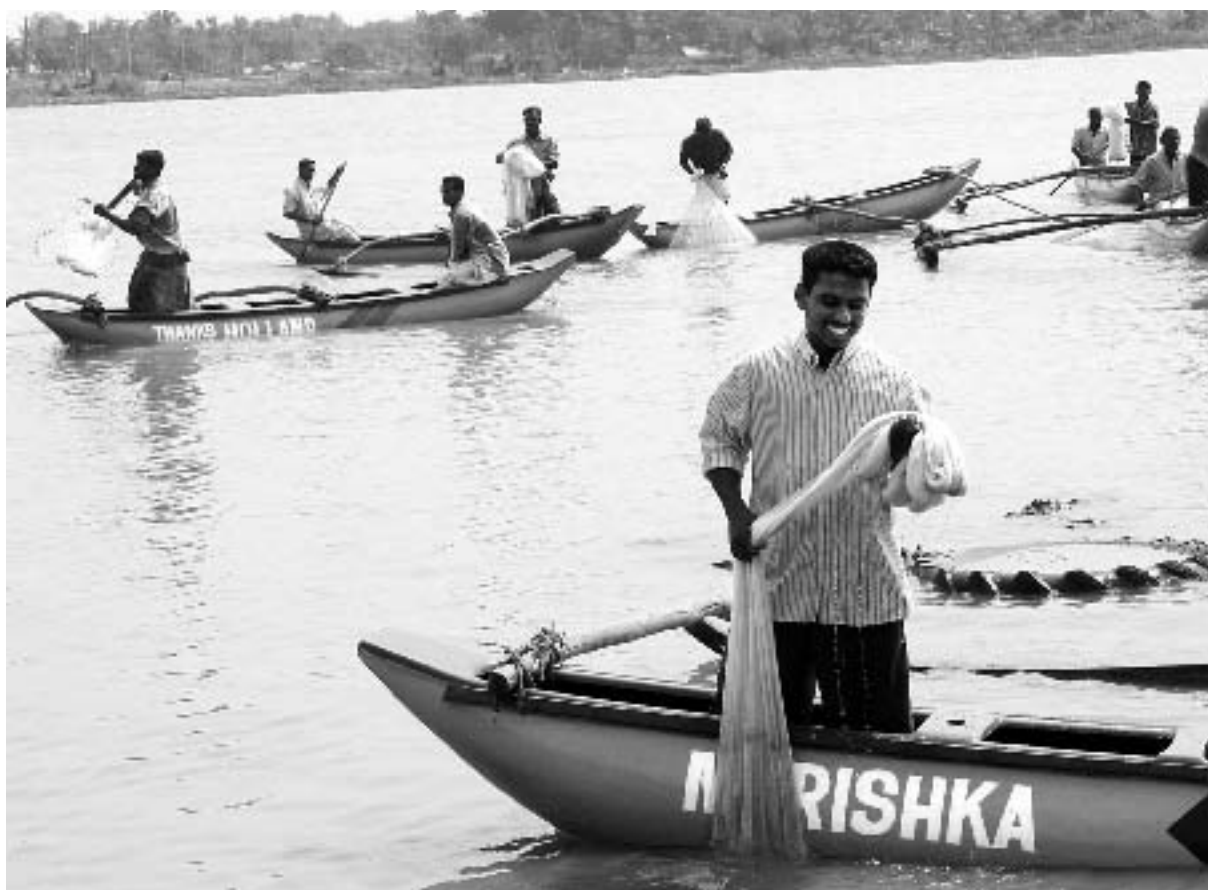
Nieuwe boten en visgerei voor gedupeerde vissers in Sri Lanka.