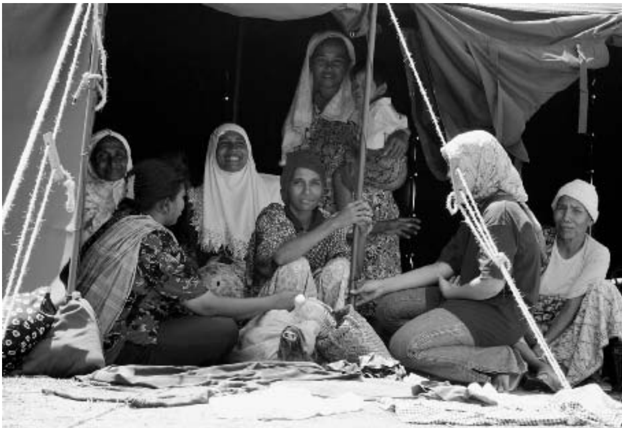
Tijdelijk onderdak op Atjeh.