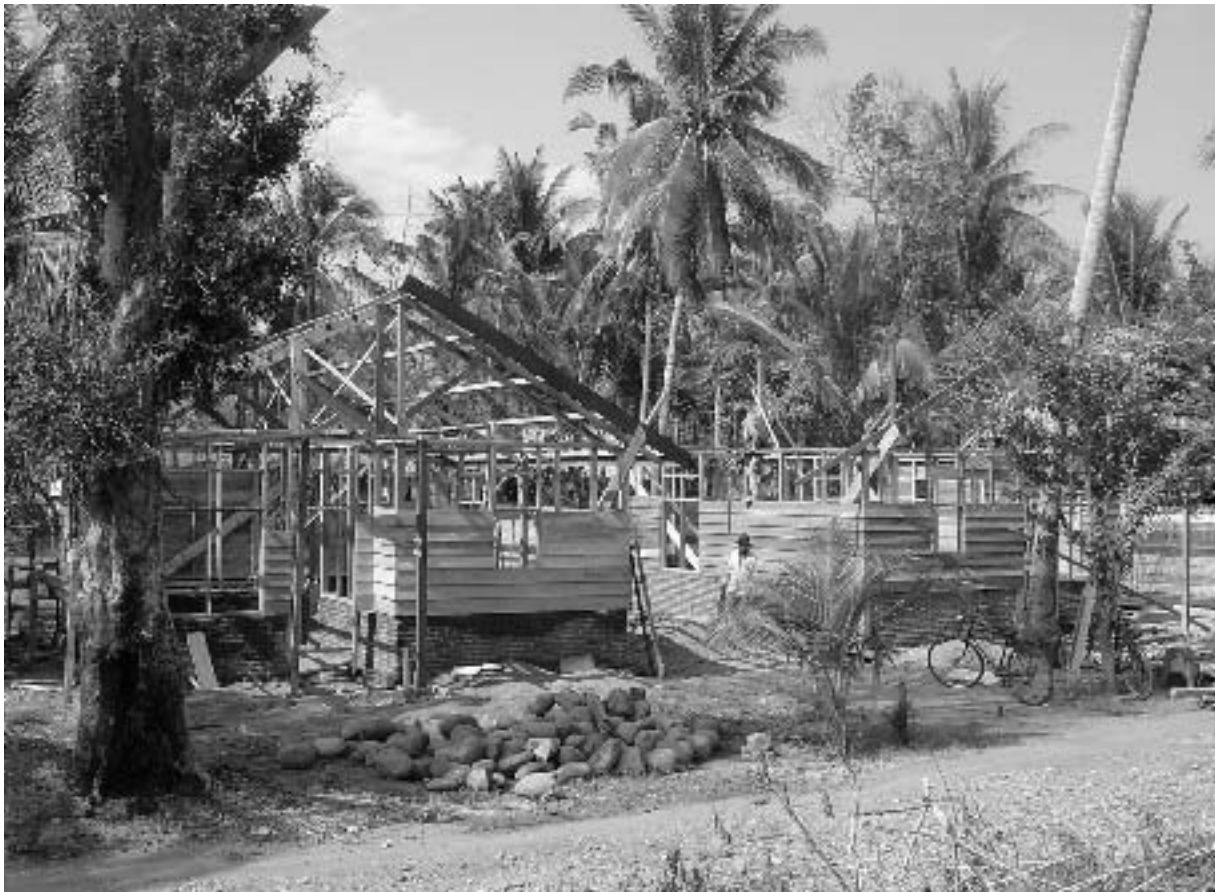
Huizenbouw in Atjeh.