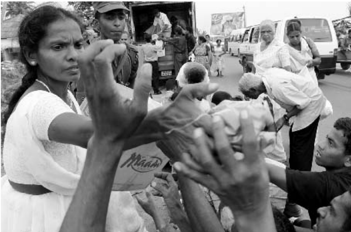
Uitdelen van voedsel op Sri Lanka.