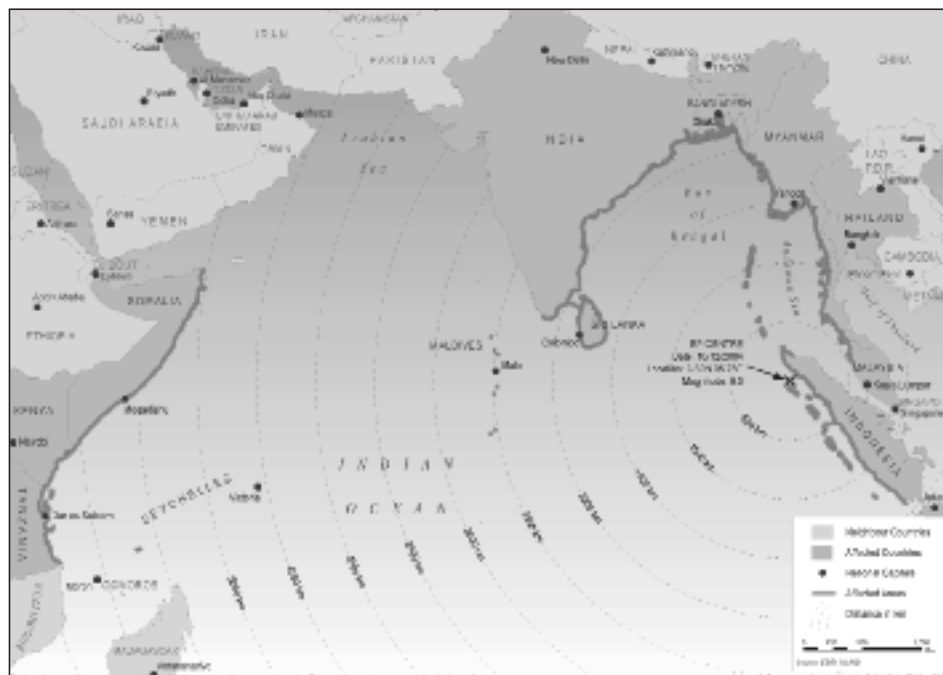
Figuur 1: Reikwijdte van de tsunami.

Ruim vijf maanden geleden, op 26 december tweede kerstdag, beukten verwoestende golven van een tsunami hard op de kusten van Zuidoost-Azië en Somalië. Er gingen twee aardbevingen, waarvan één zeer krachtig, aan vooraf. De ravage was onvoorstelbaar. Het dodental is geschat op meer dan 176.000, zo'n 50.000 mensen zijn nog vermist en meer dan een miljoen mensen zijn ontheemd.